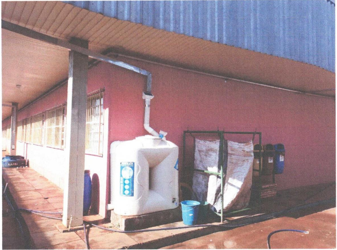
FIGURA 1 – SISTEMA DE CAPTAÇÃO DE ÁGUA DA CHUVA NA ESCOLA EMEB MARIA CELICIA.